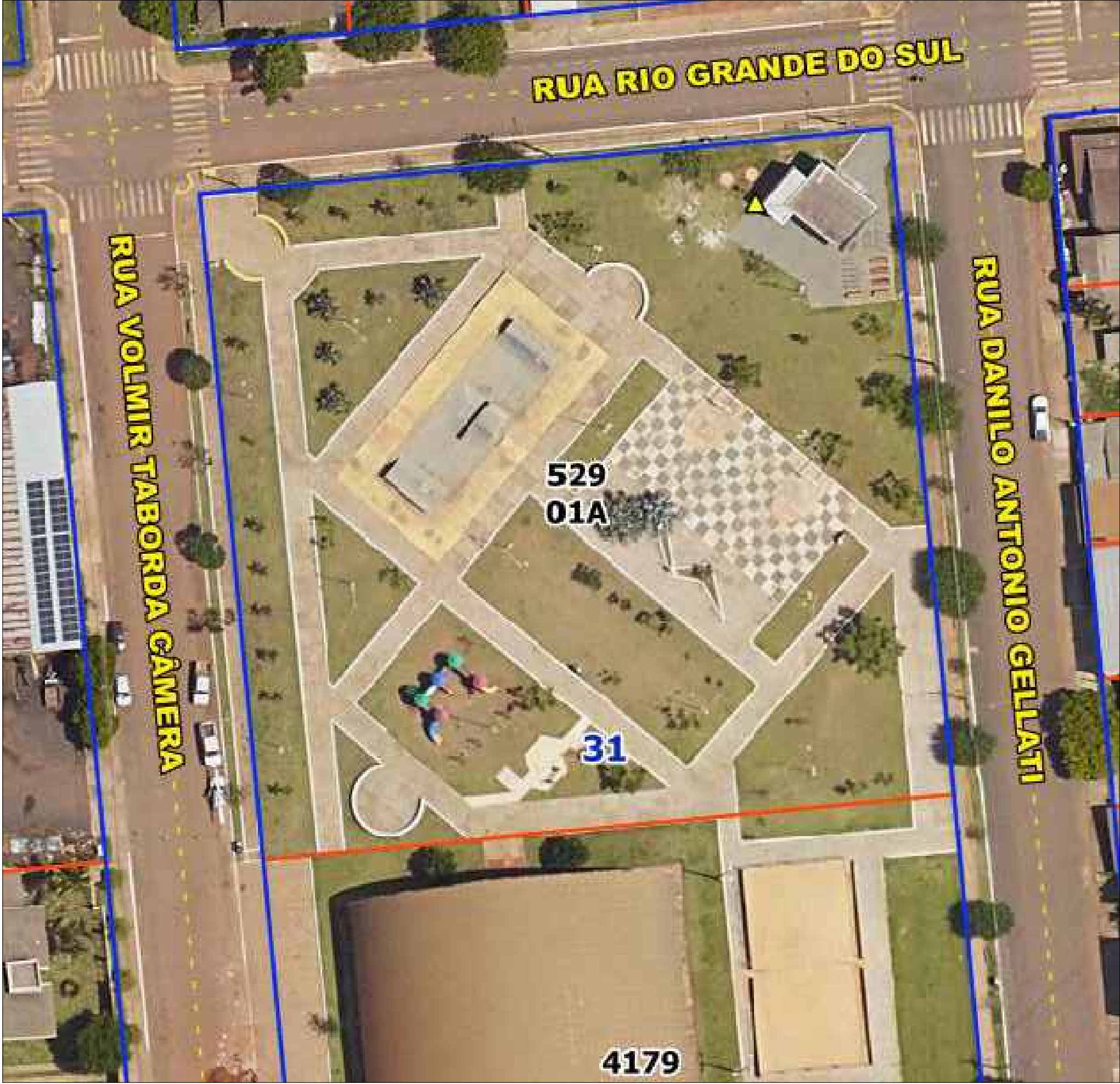
VISTA DE IMPLANTAÇÃO Sem Esc